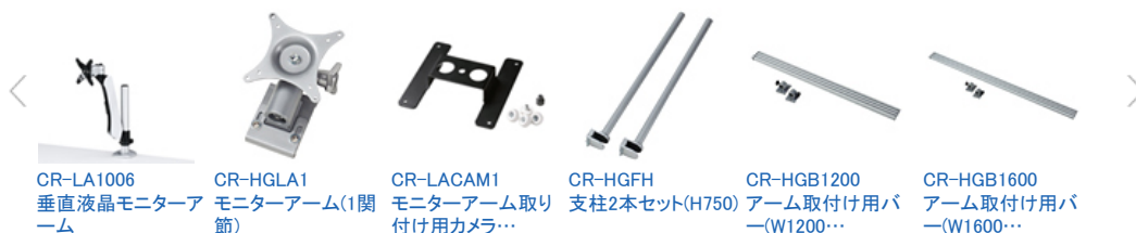
CR-LA1006 垂直液晶モニターアーム